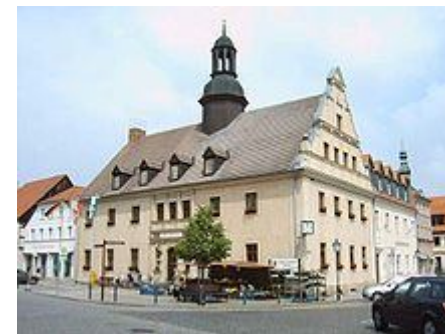
(Rathaus von Bad Belzig)

Besuch der Tourismusbörse - Marktplatz und Burg Eisenhardt, Bad Belzig