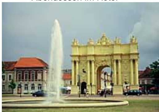
(Brandenburger Tor in Potsdam)